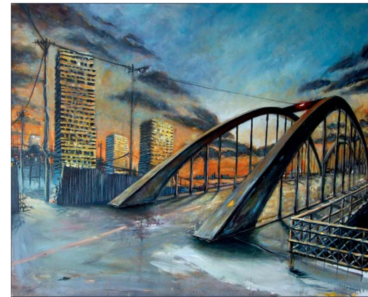
■ Boris Foscolo Une ville...mégapole...Foscolo saisit l'âme, donne une représentation presque vivante... bien qu'aucun humain ne semble habiter ces lieux... Golden Islands - Huile s/toile - 100x80