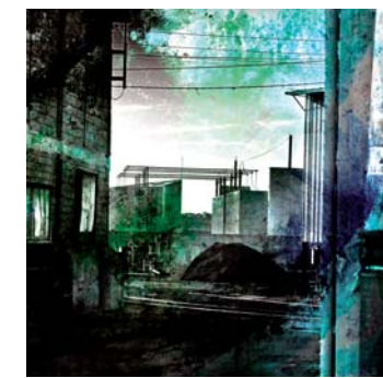
■ Philippe Beuf La ville magnifiée par la photographie... Un univers irréel, une aube, un crépuscule... la fin d'un monde ou bien une renaissance ? Pass and Future - Photographie sur aluminium - 80x120

Arrêt sur image : un pont apparemment banal, taillé dans un béton gris et immuable, qui se dresse d'un bout à l'autre de la ville indifférente ; arrêté dans le temps : le bleu vif du ciel percute le gris délavé de l'imposante armature. Arrêt sur le personnage : Urban parcourt les banlieues de France et d'Amérique avec pour seul bagage son carnet de croquis, puis au retour, il s'enferme dans son atelier nuit et jour afin de transmettre l'image conservée par le dessin.