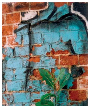
■ Karine Paoli Nature et urbain en harmonie... Poésie d'un lieu immortalisée par Karine Paoli... ce lieu n'existe plus tel quel aujourd'hui... car renové depuis... Graf 02 - Photographie collée sur aluminium - 50x75