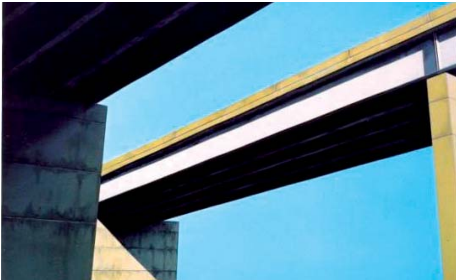
■ Urban Metz Géométrie, lignes qui rythment le monde, Le gris du béton, ses ombres et ses lumières...Urban Metz peint avec une infinie poésie, ces architectures qui fascinent le bleu pur du ciel...