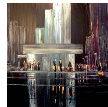
■ Ch.Sanséau nous avait jusqu'ici habitués aux grands espaces de la nature... Mer, Désert... mais quand il rencontre la ville, il nous montre encore quel peintre il est !...et mettant toujours en avant, la vie des hommes, bien présents au milieu de cette écrasante architecture... Métro - huile/toile - 100x100