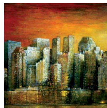
■ Lyne C. Cette jeune artiste attrape à bras-le-corps, la grande cité...et domestique pour notre regard, les immenses perspectives, avec une matière généreuse, aux couleurs fortes...